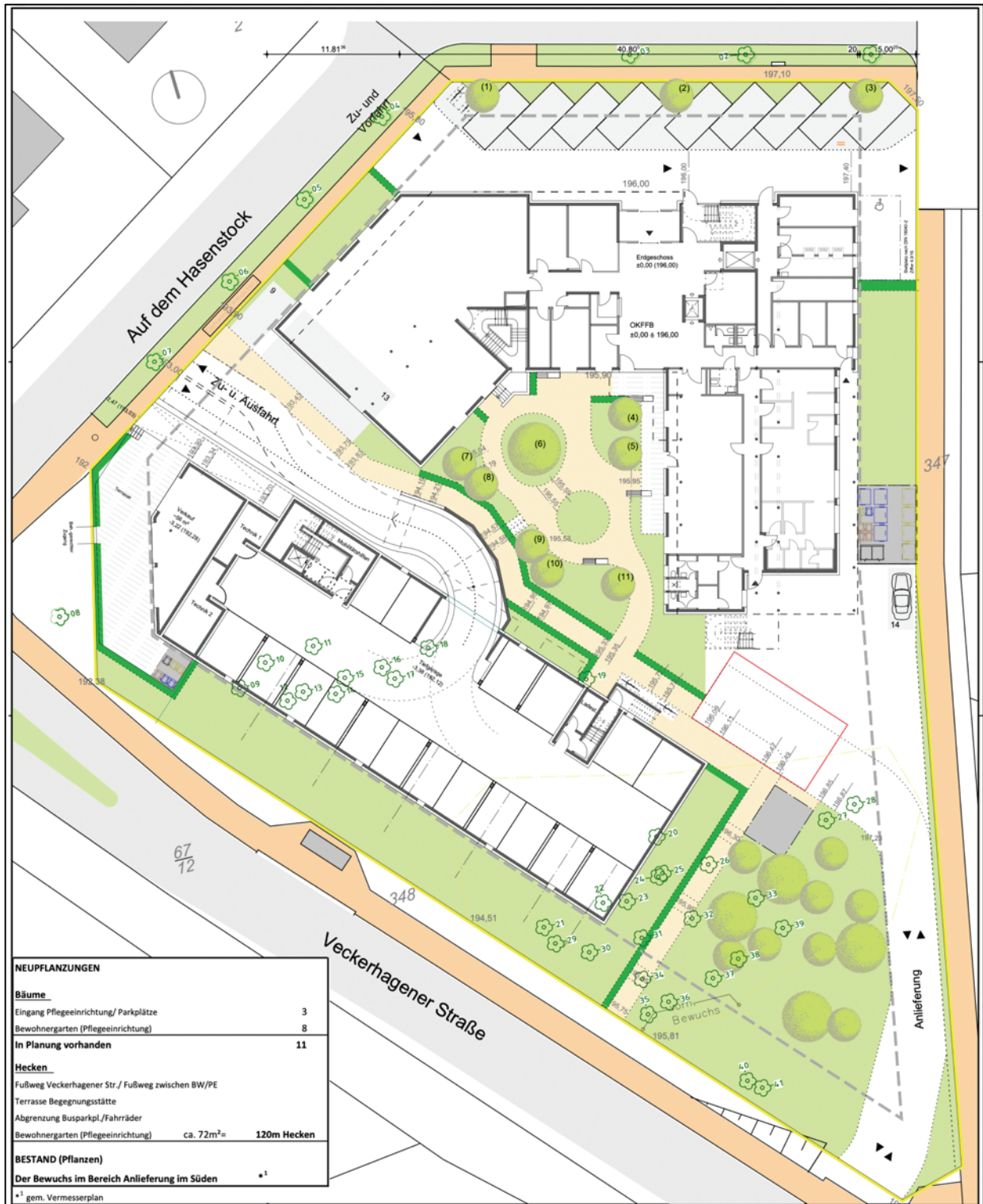
Abbildung 8: Städtebauliches Konzept und Freiflächenplanung (Quelle: Swoboda, Behr-Swoboda – Architekten + Ingenieure + Generalplaner, 2023, ohne Maßstab)