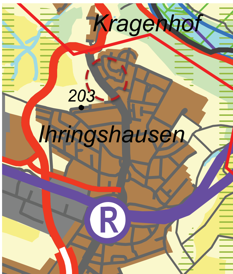
Abbildung 5: Ausschnitt aus dem RPN 2009 mit Kennzeichnung des Plangebiets

Der 2010 in Kraft gesetzte Regionalplan Nordhessen 2009 (RPN) weist das Plangebiet als Vorranggebiet Siedlung Bestand aus. Westlich grenzt unmittelbar die Landstraße Veckerhagener Straße an, südlich, östlich und nördlich ein Vorranggebiet Siedlung Bestand. Westlich der Landstraße schließt ein Vorbehaltsgebiet für Landschaft an. Die geplante Änderung des Sondergebiets im Sinne des in Wert setzens eines gegenwärtig nicht genutzten Standortes innerhalb des Siedlungsbereichs zu einem Sondergebiet für die Unterbringung einer Alteneinrichtung entsprechen der Darstellung des Regionalplanes. Mit der durch den Bebauungsplan beabsichtigten Ausweisung des Sondergebiets Alteneinrichtung wird die bereits abgebildete und im angrenzenden Bestand schon vorhandene Wohnnutzung gestärkt..