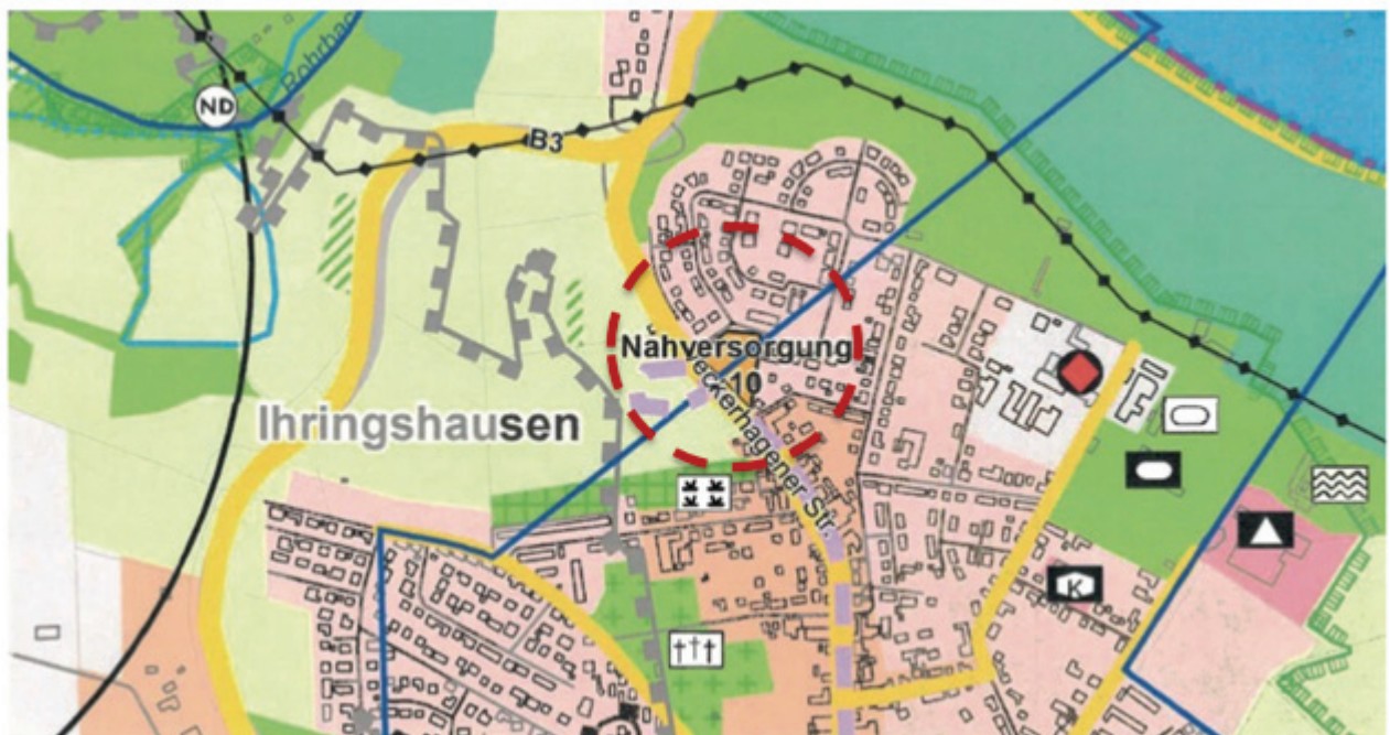
Abbildung 4: Ausschnitt aus dem Flächennutzungsplan mit Kennzeichnung des Plangebiets (Quelle: ZRK, 2023, ohne Maßstab)

Beim Zweckverband Raum Kassel (ZRK) wurde mit Datum vom 08.10.2021 die Änderung des Flächennutzungsplans für den Änderungsbereich 2 „Hasenstock“ beantragt. Der ZRK hat daraufhin die Flächennutzungsplan-Änderung ZRK 58 „Sondergebiet Stockbreite / Hasenstock“ eingeleitet. Die Änderung soll zusammen mit dem Änderungsbereich 1 „Stockbreite“ – unabhängig zu dem hier zugrunde liegenden Bebauungsplanverfahren sowie der 2. Änderung des Bebauungsplans Nr. 24 „Hasenstock“ im Parallelverfahren (§ 8 Abs. 3 S. 1 BauGB) durchgeführt werden. Die Darstellung des Flächennutzungsplanes soll von Sondergebiet (SO) Nahversorgung in ein Sondergebiet (SO) Alteneinrichtung geändert werden.