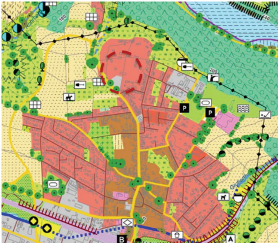
Abbildung 6: Ausschnitt aus dem Landschaftsplan (2007) mit Kennzeichnung des Plangebiets (ohne Maßstab)

Im Landschaftsplan des Zweckverbandes Kassel (ZRK) aus dem Jahr 2007 liegt der Geltungsbereich der 2. Änderung des Bebauungsplans Nr. 24 „Auf dem Hasenstock“ in einer Fläche mit der vorgesehen Realnutzung Industrie und Gewerbe. Umgeben sind diese Flächen von Ein- und Zweifamilienhäusern. Die Veckerhagener Straße ist als Verkehrsfläche mit Baumpflanzungen ausgeschrieben.