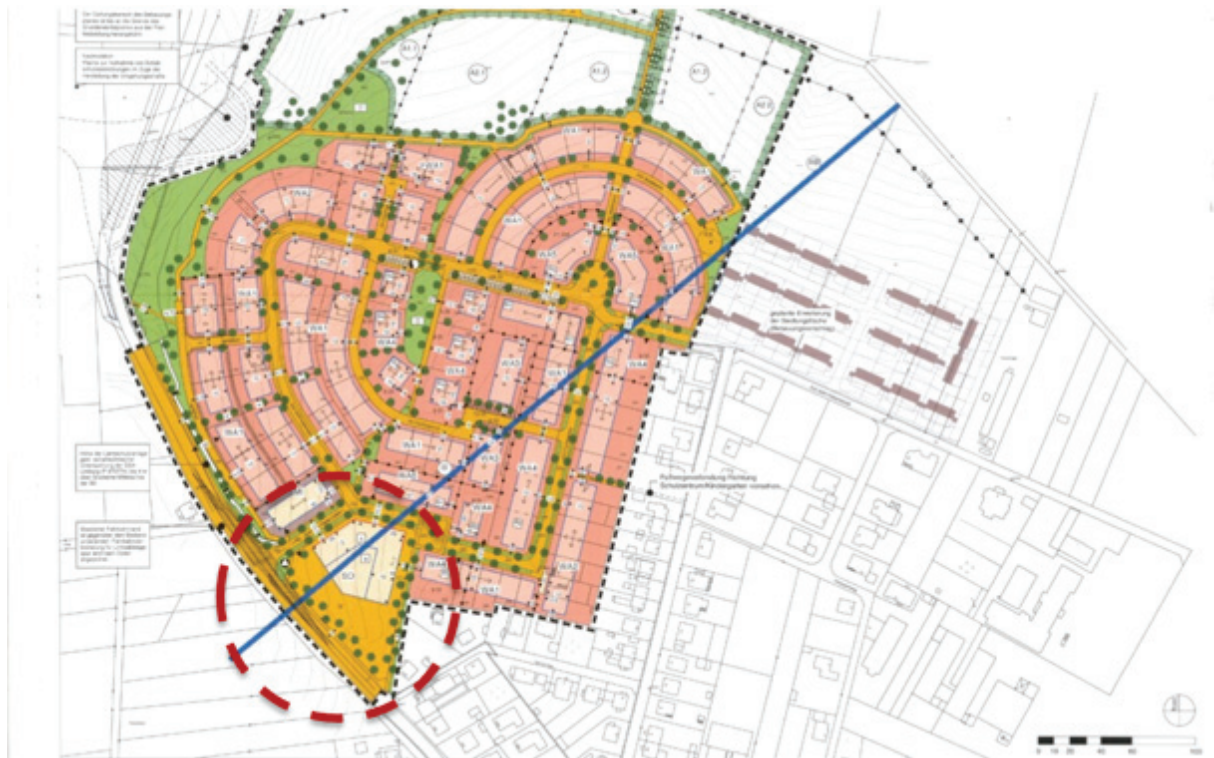
Abbildung 7: Ausschnitt aus dem rechtskräftigen Bebauungsplan Nr. 24 "Auf dem Hasenstock", 1. Änderung mit Kennzeichnung Plangebiet

Die u.a. als Ausgleichsmaßnahme in der 1. Änderung als anzupflanzend auf der Fläche des geplanten Nahversorgungsstandortes festgesetzte Bäume, wurden im Zuge der Umsetzung der Ausgleichsmaßnahmen noch nicht gepflanzt und werden daher in der weiteren Planung beachtet.