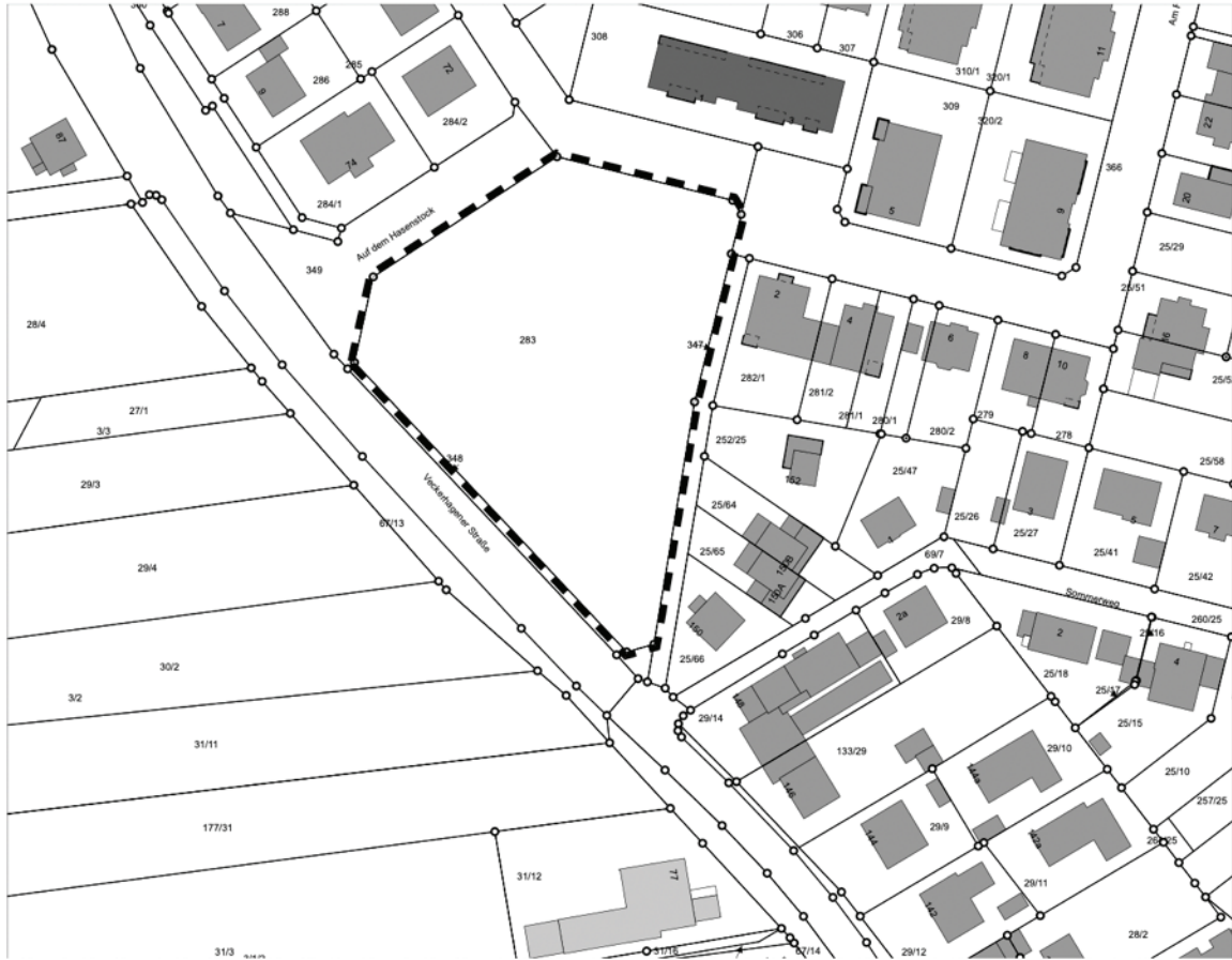
Abbildung 1: Geltungsbereich des Bebauungsplans (Quelle: eigene Darstellung, ohne Maßstab)