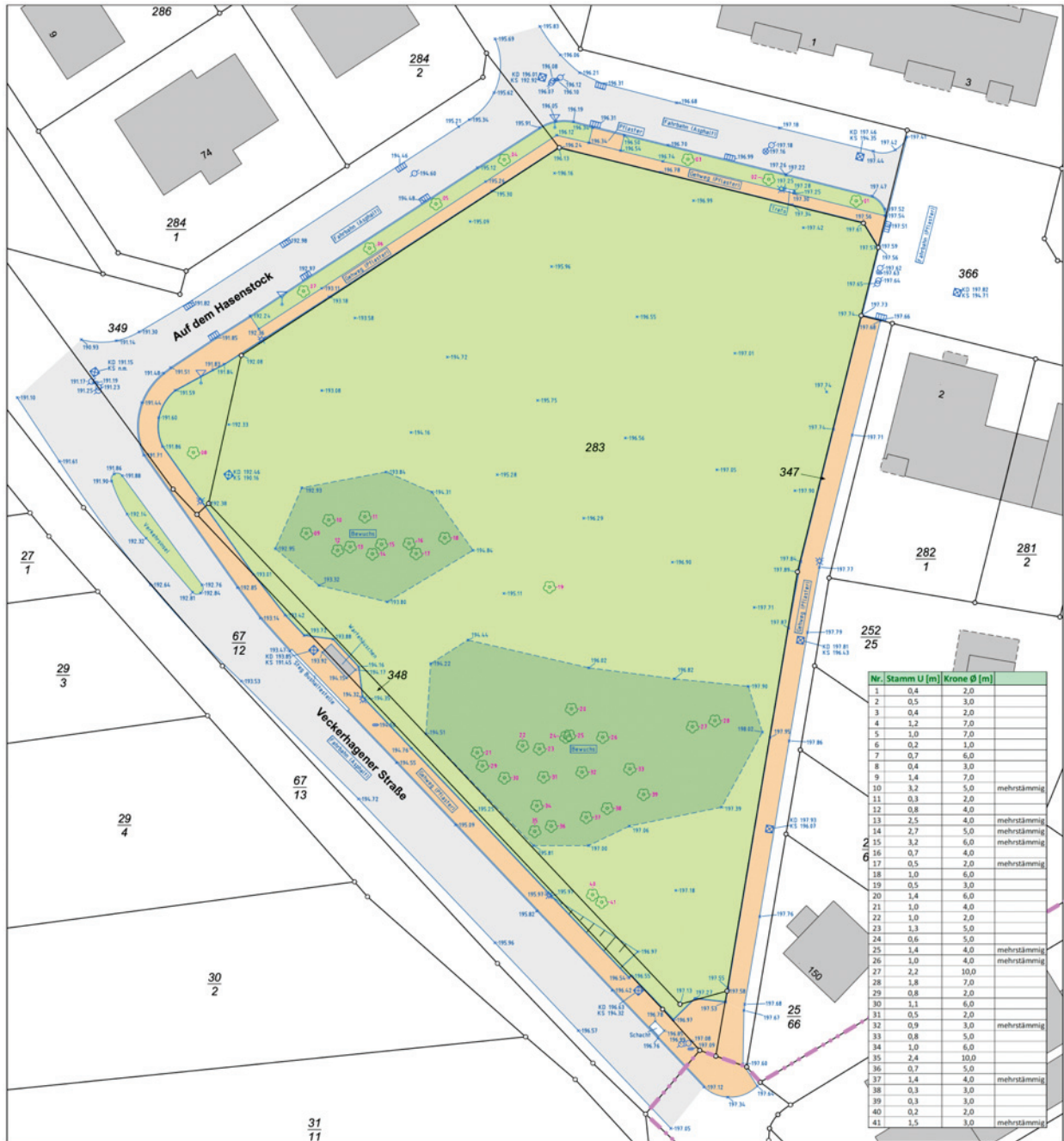
Abbildung 3: Aufmaß des Baumbestands (Quelle: buck Vermessung, 2023, ohne Maßstab)