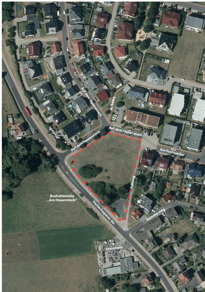
Abbildung 2: Luftbildausschnitt mit Kennzeichnung Plangebiet

Bei der angrenzenden Bebauung handelt es sich in erster Linie um Einfamilienhäuser, im Norden und im Nord-Westen grenzen zudem mehrere mehrgeschossige Wohngebäude (Geschosswohnungsbau) an. Die Fläche selbst erweckt den Eindruck einer massiven Lücke im städtebaulichen Gefüge und könnte sich deshalb in besonderem Maße dafür eignen, ein zusammenhängendes Ortsbild herzustellen. Insgesamt handelt es sich um eine sehr homogene bauliche Struktur, die es zu vervollständigen gilt. Die im Luftbild in Abbildung 2 dargestellte Situation entspricht dem ursprünglichen Bebauungszustand vor der 2. Änderung des Bebauungsplans Nr. 24 „Auf dem Hasenstock“.